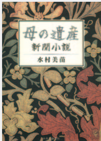
Cover design © Horiguchi Toyota.